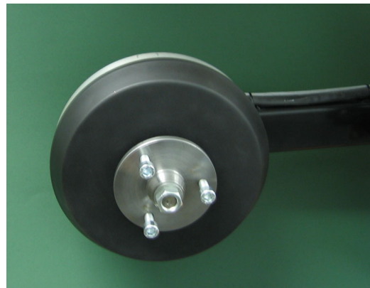
Bild 1. SDG Nabenmotor

Elektromotoren mit der SDG Konstruktion werden beim Direktantrieb von Automobilen, Fahrrädern, Motorrädern, Autobussen, Staplern, Rollstühlen und anderen Fahrzeugen eingesetzt. Sie können auch in Booten und Flugzeugen oder als Torquemotore und Generatoren eingesetzt werden. Bild 1 zeigt einen Elektromotor mit einer Flansche für die Radbefestigung.